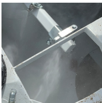
LAVAGE AUTOMATIQUE HAUTE PRESSION