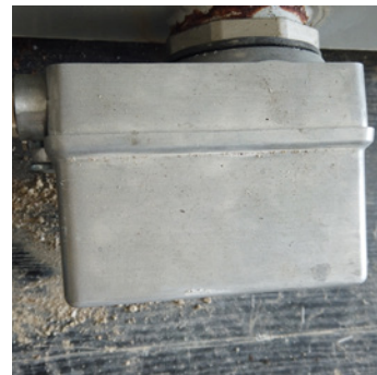
CHAUFFE-EAU POUR LE RÉSERVOIR D'EAU