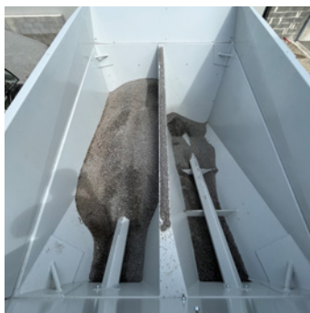
REHAUSES DE TRÉMIES