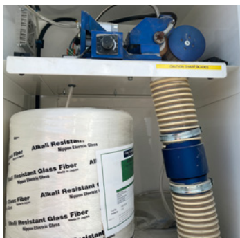
DISTRIBUTEUR DE FIBRE