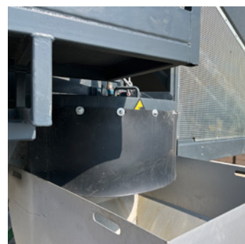
DOUBLE TRAPPE DE VIDANGE POUR L'ÉVACUATION DU LAVAGE