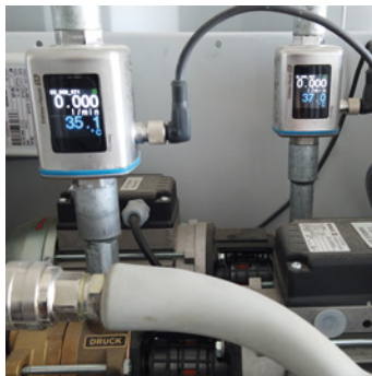
POMPE À ADJUVANT AVEC DÉBITMÈTRE