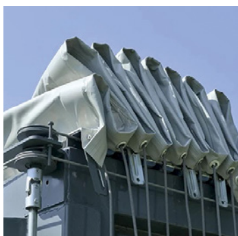
BÂCHE DE TRÉMIES