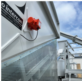
MOTEUR VIBRANT SUR LES TRÉMIES